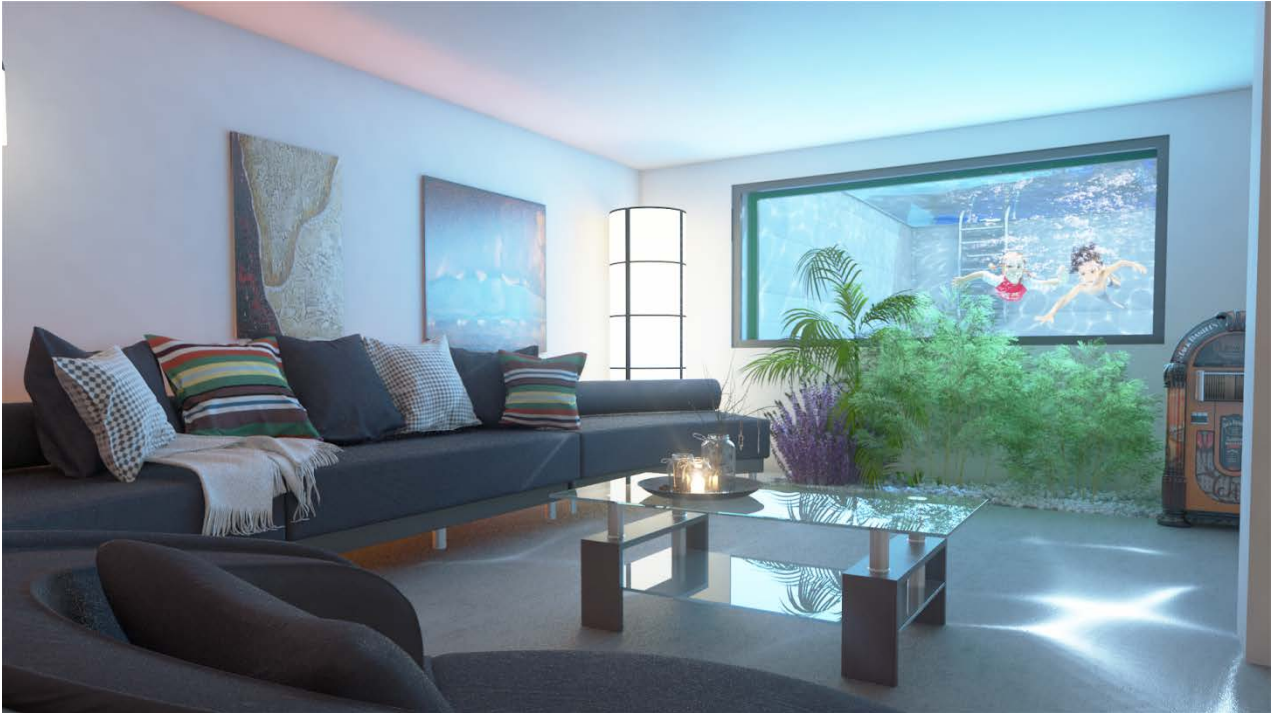
Planta Semisótano. Comunicación con la piscina.