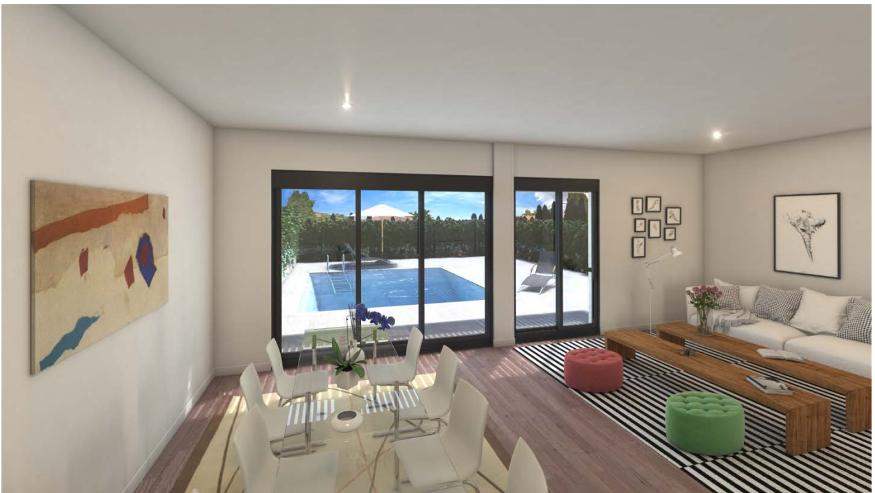
Planta Baja. Salida a la terraza.