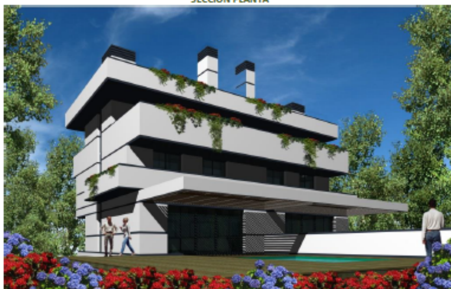
CHALET D – VISTA ZONA AJARDINADA